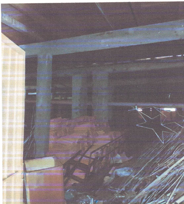
Foto 01: acúmulo de enfeites natalinos telhas e mobiliários descartados